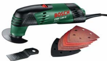
Empfehlung vom Heimwerkerkönig