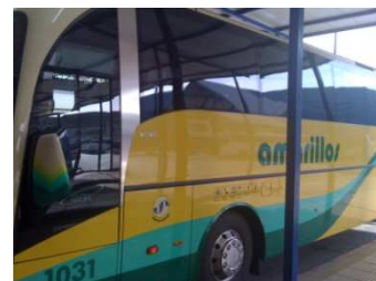
Bus Richtung Algodonales