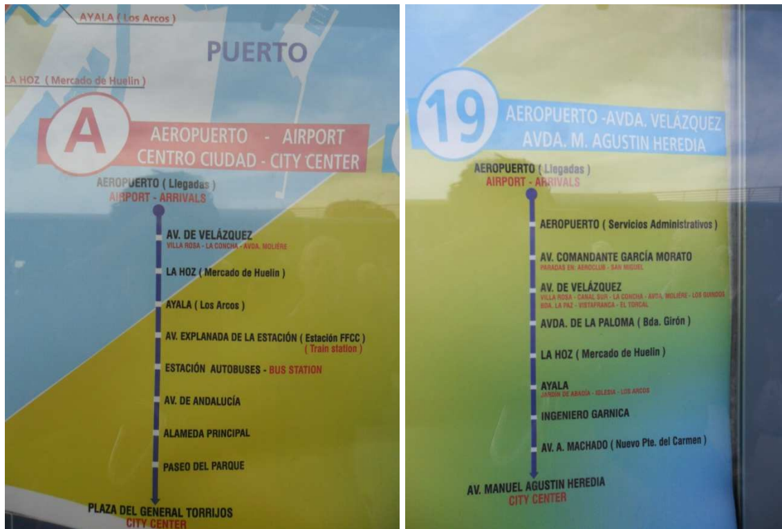
Linie 19 fährt Richtung Malaga Innenstadt. SIE HÄLT NICHT AM BUSBAHNHOF. Linie A fährt zum Busbahnhof und zum Shoppingcenter. Von dort fahren die Busse nach Algodonales