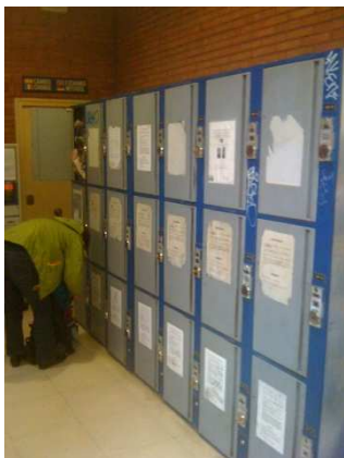
Schließfächer am Busbahnhof (klein)

Zuerst muss man vom Flughafen in die Innenstadt fahren. Von dort fahren die Busse nach Algodonales. Abfahrt Richtung Innenstadt ist Ausgang Terminal 3 (Ankunft große Halle) Salidas Desde Aeropuerto . Die Busse fahren alle halbe Stunde Richtung Malaga Innenstadt. Aussteigen am Busbahnhof: Estacion Bus/ Bus Station (ca. 15 min Fahrzeit). Direkt hinter dem Busbahnhof ist ein Shopping Forum das auch Sonntags geöffnet hat (Kinos, Einkauf, Spielhallen usw.)