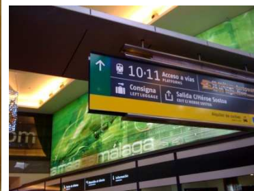
Shopping Forum und Zugbahnhof Estacion Maria Zambrano mit Gepäckaufbewahrung, direkt hinter dem Busbahnhof