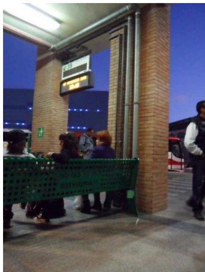
Ausstieg am Busbahnhof Malaga (Linie A). Von hier fahren auch die Busse zurück zum Flughafen