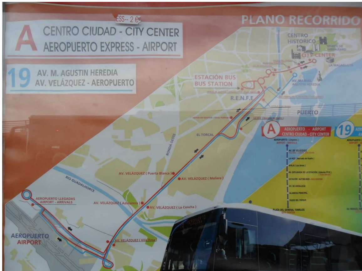
Übersichtsplan Linie A und Linie 19 vom Flughafen Malaga