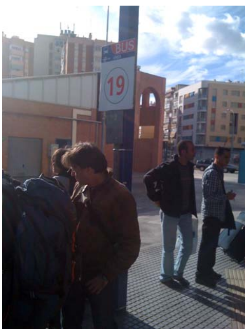
Ausstieg am Busbahnhof Malaga