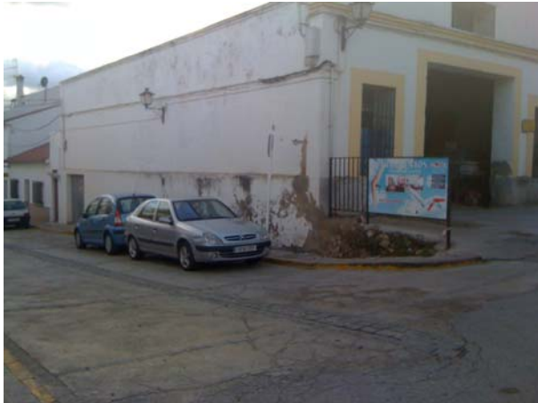
Richtung Ganterfly Appartements