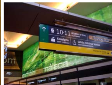
Shopping Forum und Zugbahnhof Estacion Maria Zambrano mit Gepäckaufbewahrung, direkt hinter dem Busbahnhof