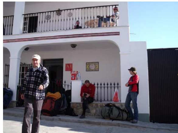
Unterkunft Ganterfly Appartements