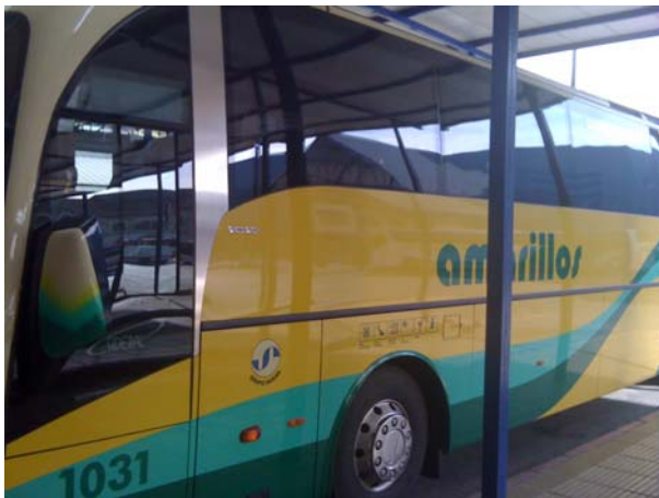
Bus Richtung Algodonales