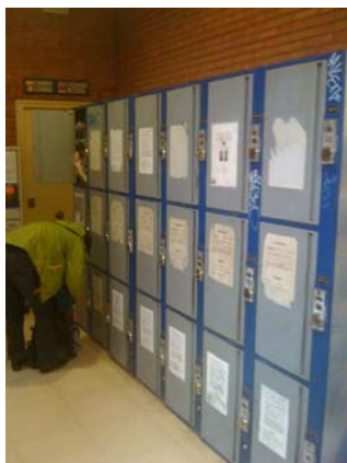
Schließfächer am Busbahnhof (klein)

Zuerst muss man vom Flughafen in die Innenstadt fahren. Von dort fahren die Busse nach Algodonales. Abfahrt Richtung Innenstadt ist Ausgang Terminal 2 (Ankunft), ca. 50 Meter rechts, Linie 19, Salidas Desde Aeropuerto . Die Busse fahren alle halbe Stunde Richtung Malaga Innenstadt. Aussteigen am Busbahnhof: Estacion Bus/ Bus Station (ca. 25min Fahrzeit). Direkt hinter dem Busbahnhof ist ein Shopping Forum das auch Sonntags geöffnet hat (Kinos, Einkauf, Spielhallen usw.)