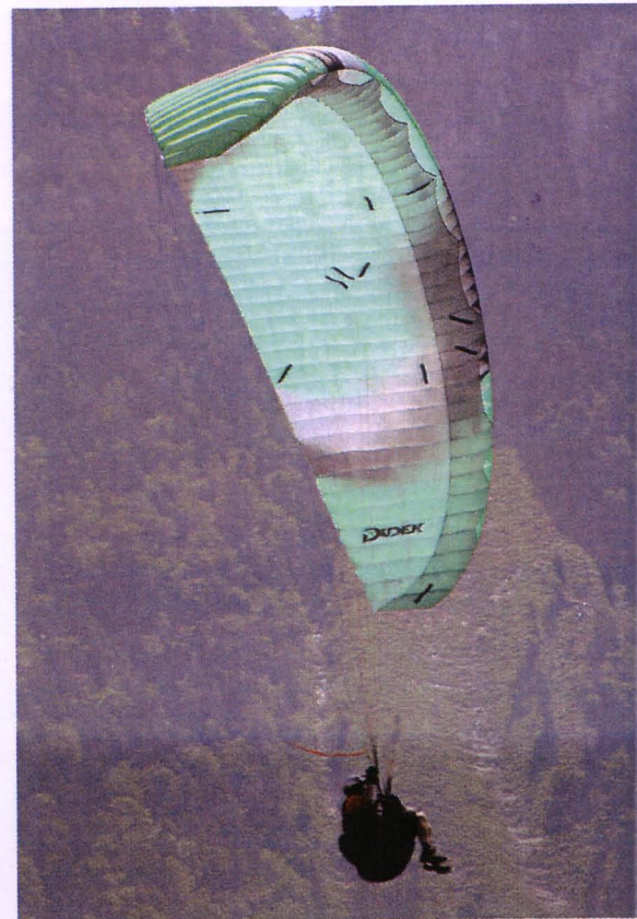
La Dudek Synthésis, aile de paramoteur, en essai dans VL 375.