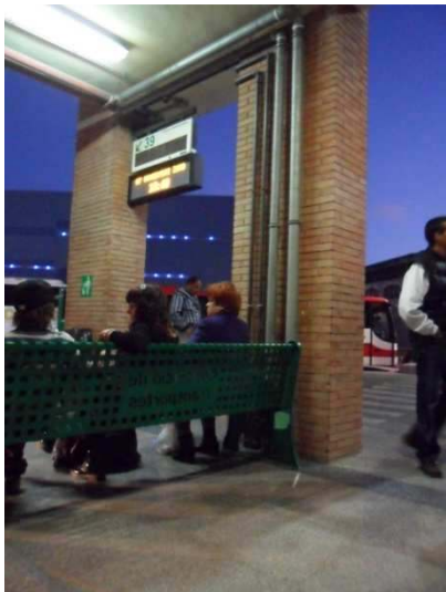
Ausstieg am Busbahnhof Malaga (Linie A). Von hier fahren auch die Busse zurück zum Flughafen