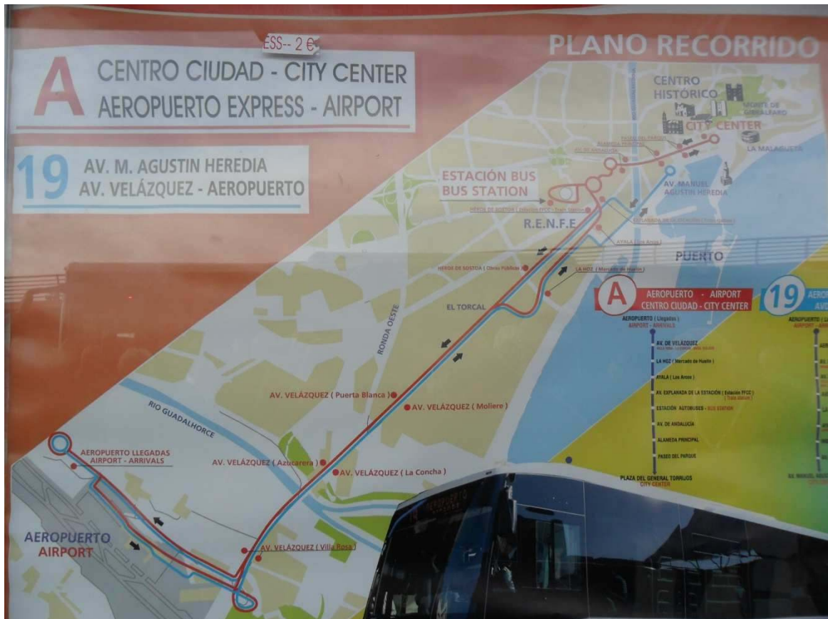
Übersichtsplan Linie A und Linie 19 vom Flughafen Malaga