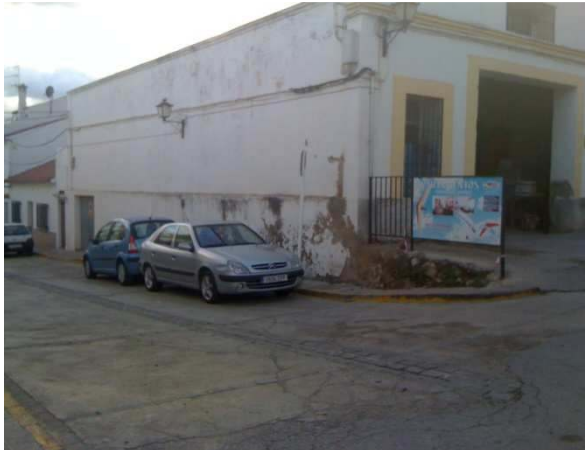
Richtung Ganterfly Appartements