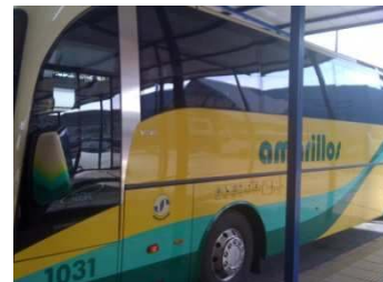
Bus Richtung Algodonales