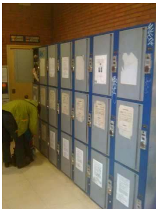
Schließfächer am Busbahnhof (klein)

Zuerst muss man vom Flughafen in die Innenstadt fahren. Von dort fahren die Busse nach Algodonales. Abfahrt Richtung Innenstadt ist Ausgang Terminal 3 (Ankunft große Halle) Salidas Desde Aeropuerto . Die Busse fahren alle halbe Stunde Richtung Malaga Innenstadt. Aussteigen am Busbahnhof: Estacion Bus/ Bus Station (ca. 15 min Fahrzeit). Direkt hinter dem Busbahnhof ist ein Shopping Forum das auch Sonntags geöffnet hat (Kinos, Einkauf, Spielhallen usw.)