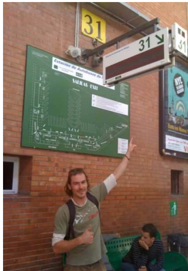
Abfahrt Richtung Algodonales vom Busbahnhof. Linie „Los Amerillos“